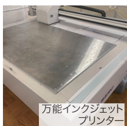
万能インクジェットプリンター