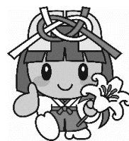
多賀町マスコットキャラクター 「たがゆいちゃん」