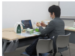
昨年度のオンライン商談会の様子

また、事業者数を限定して 日本橋「ここ滋賀」 での テスト販売の機会 を提供します。テスト販売は、一般消費者の反応や評価を把握したり、商品の魅力の伝え方やPRの方法などを学ぶことを目的とし、参加事業者自らが店頭にて販売・商品PRを行うものです。